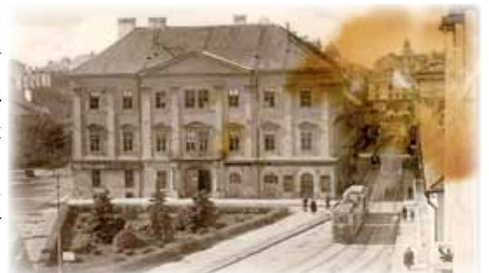
Palatul Mocioni, primul sediu al Întreprinderii de apă-canal a Timișoarei. În partea stângă se poate vedea Cazarma Transilvania, demolată în anii '60

Salubritatea orașului Timișoara s-a înființat în 1911 și a funcționat ca serviciu comunal până în 1938, când, împreună cu activitatea de hornărit, a trecut la A.C.O.T.. La rândul ei, întreprinderea și-a schimbat denumirea în I.T.A.S., întreprinderea pentru alimentarea cu apă, canalizare, hornărit și salubritate. Modificarea s-a făcut în baza legii apărute în acel an, 1938, pentru organizarea exploatărilor comunale. În baza aceleiași legi, în oraș au fost înființate încă două regii publice comerciale: întreprinderea Electromecanică Timișoara (I.E.T.), având ca activități transportul în comun cu tramvaiele și exploatarea Uzinei electrice, precum și Stabilimentele Economice Timișoara (S.E.T.), ce avea în subordine cinematografele, abatorul, serviciile funerare și băile publice.