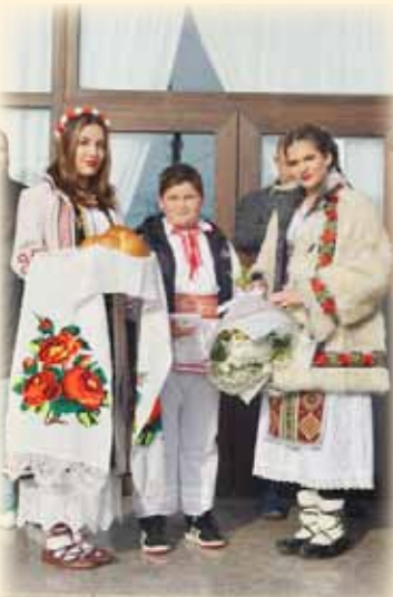
Pâinea și sarea pământului pentru Mitropolitul Banatului Ioan cel Bun