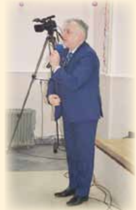
Excelența Sa Coriolan Gârboni, Consul onorific al Republicii Coreea de Sud