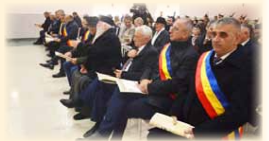
Imagine din sală