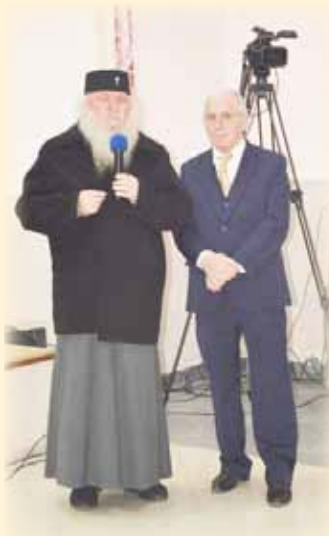
Înaltpreasfințitul Ioan rostind cuvântul său către adunare