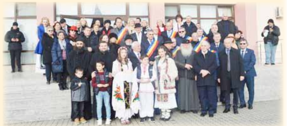
Înaltpreasfințitul Mitropolit alături de invitați