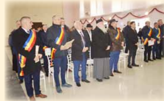
Intonarea imnului național al României