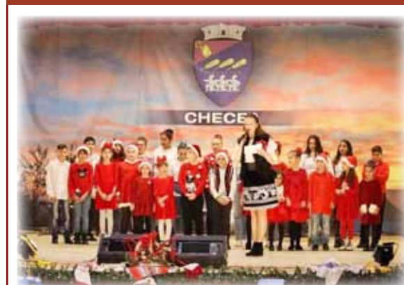
Copiii checeni la colindat.