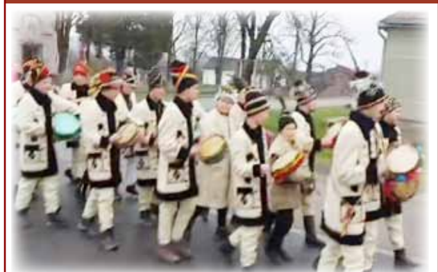
Dubașii din Bata