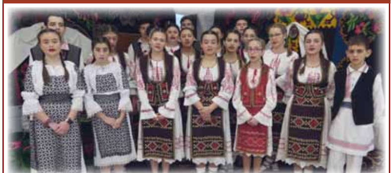
Ansamblul „Vermeșana” păstrător al obiceiurilor și tradițiilor de Crăciun.