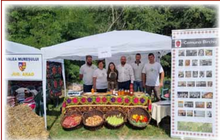
Festivalul plăcintelor 2023

Pagină coordonată de Andrei Horațiu CIPRIAN