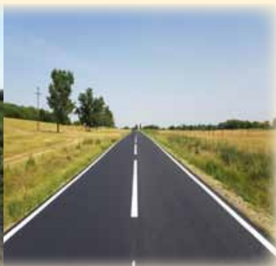
DC 77 Cralovăț