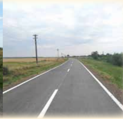
DC 144 Topolovățu Mic