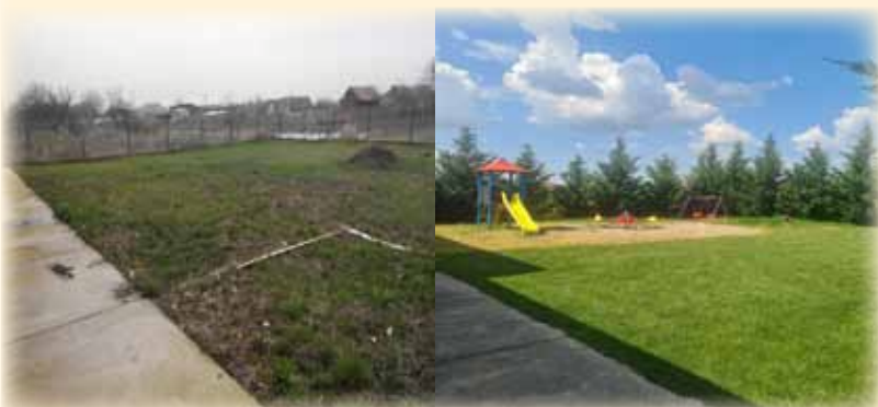
Loc de joacă Grădiniță