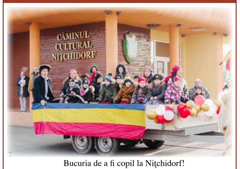
Bucuria de a fi copil la Nițhidorf!