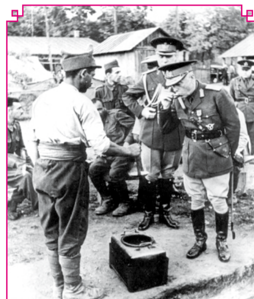
Ion Antonescu pe frontul din Basarabia, gustând din hrana soldaților - iulie 1941.