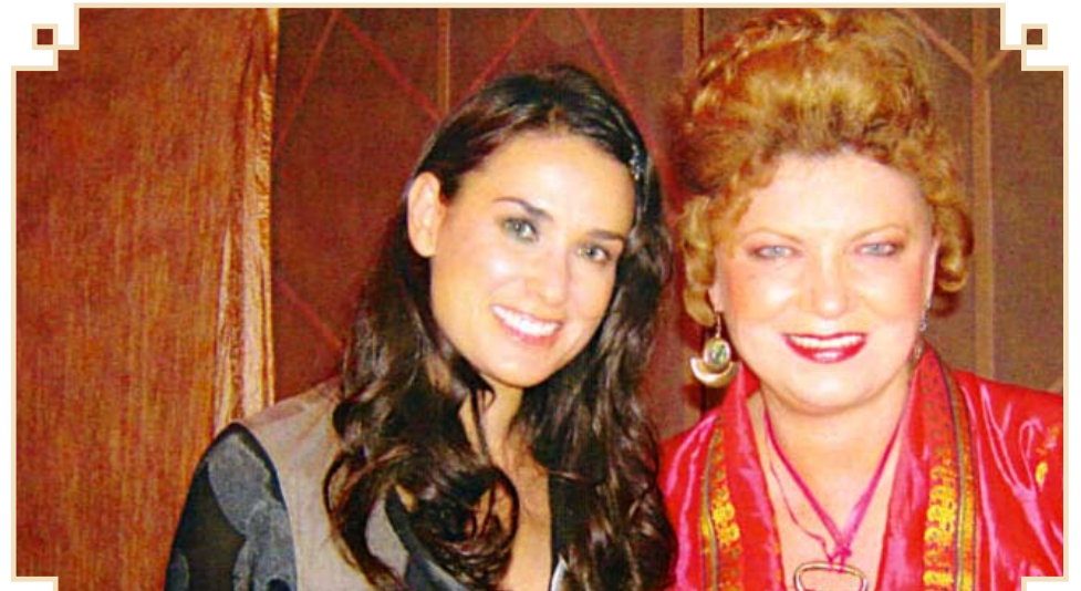
Alături de Demi Moore, în distribuția filmului "Bunraku" - 2010

Celebra invocație faustică; pe care dacă am repeta-o acum, dialogul nostru ar fi etern. Dar bucuria întâlnirii noastre, va fi eternă, pentru că noi, o vom așeza într-o cutie cu cuvinte.