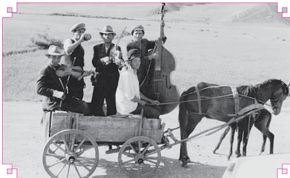
România văzută de oaspeți

S i dacă orice proces de inițiere prezintă, în diferitele sale faze, o corespondență fie cu viața omenească individuală fie chiar cu ansamblul vieții terestre, aceasta se datorește faptului se poate considera evoluția vitală ca însăși, particulară sau generală, ca desfășurarea unui plan analog cu acela pe care trebuie să-l realizeze inițiatorul pentru a se realiza pe sine însuși în deplina expansiune a tuturor potențelor ființei sale. Asemenea planuri corespund întotdeauna și pretutindeni unei aceleiași concepții sintetice, astfel încât sunt identice în principiu și, cu toate că sunt diferite între ele, și în mod nedefinit variate în ceea ce privește realizarea lor, purced toate dintr-un Arhetip ideal unic, plan universal trasat de către o forță sau o voință cosmică căreia, fără a prejudicia cu nimic asupra naturii sale, îi putem da numele de Marele Arhitect al Universului.