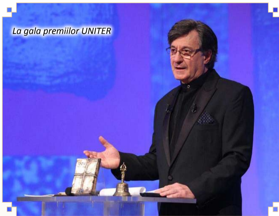
La gala premiilor UNITER

Acesta a fost, și acesta va rămâne mereu țelul grecilor, maestre Caramitru; să-i educe pe cei care nu sunt greci să fie greci.