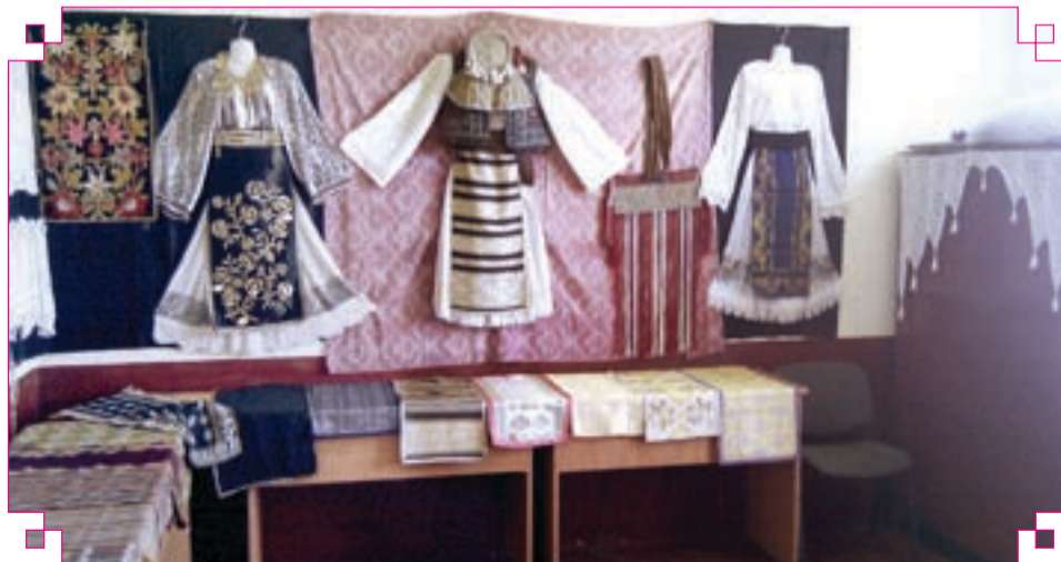
Muzeul portului popular din satul Coșarii, comuna Brestovăț, județul Timiș