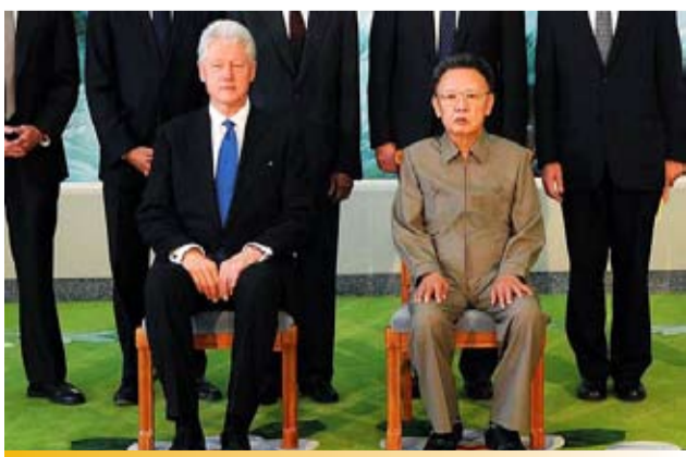
Alături de Bill Clinton

Jong-il a devenit "iubitul conducător" în 1994, ca succesor al tatălui său, Kim Il-sung, fondatorul Coreei de Nord, care a primit titlul de "Eternul Președinte". Oficial, Coreea de Nord se află calendaristic în anul '95 al "erei Kim", începută odată cu nașterea lui Kim Il-sung.