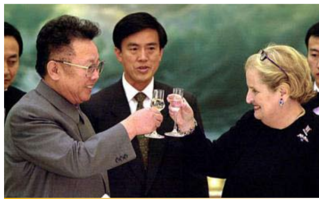
Alături de Madeline Albright

În anii '70, Jong-il a fondat "brigada de șoc", un grup alcătuit din cercetători și oameni de știință având ca scop dezvoltarea rapidă a unor sectoare defavorizate