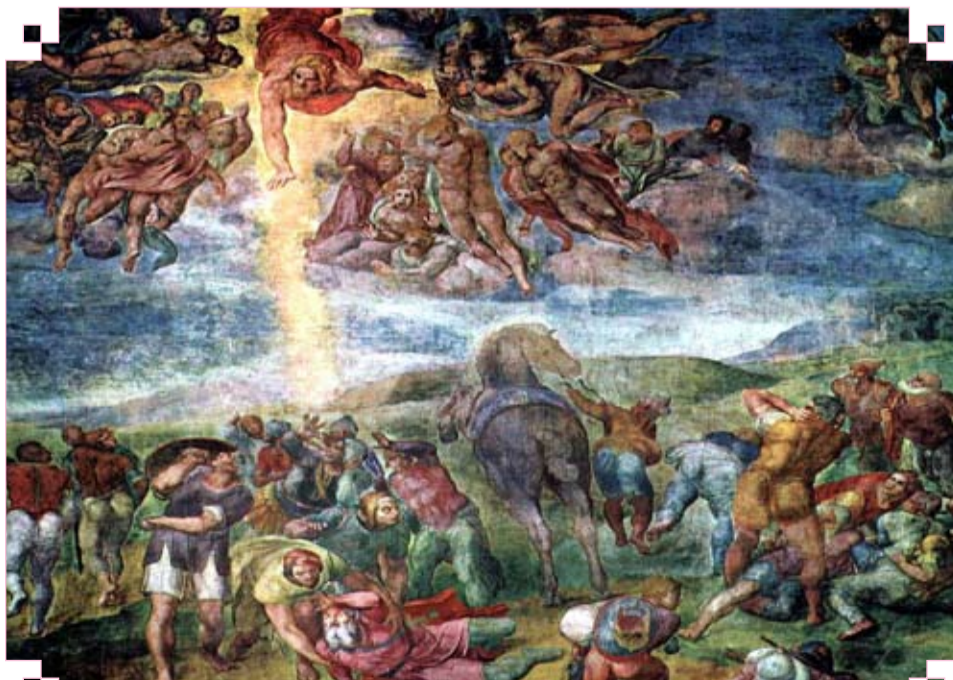
Michelangelo, Convertirea Sfântului Pavel (1542-1545)

Are dreptate evreul Fridman, George Fridman, atunci când afirmă că în lupta cu lumea musulmană, pentru Statele Unite nu victoria este țelul su-