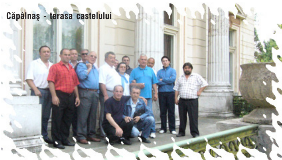
Căpâlnaș - terasa castelului

În fața castelului de la Căpâlnaș, este o fântână cu un cerb maiestuos din piatră, ca la castelele din Franța, iar în spate, parcul de opt hectare este o adevărată oază.”