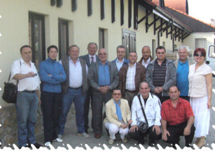
La crama contelui Grassalkovich