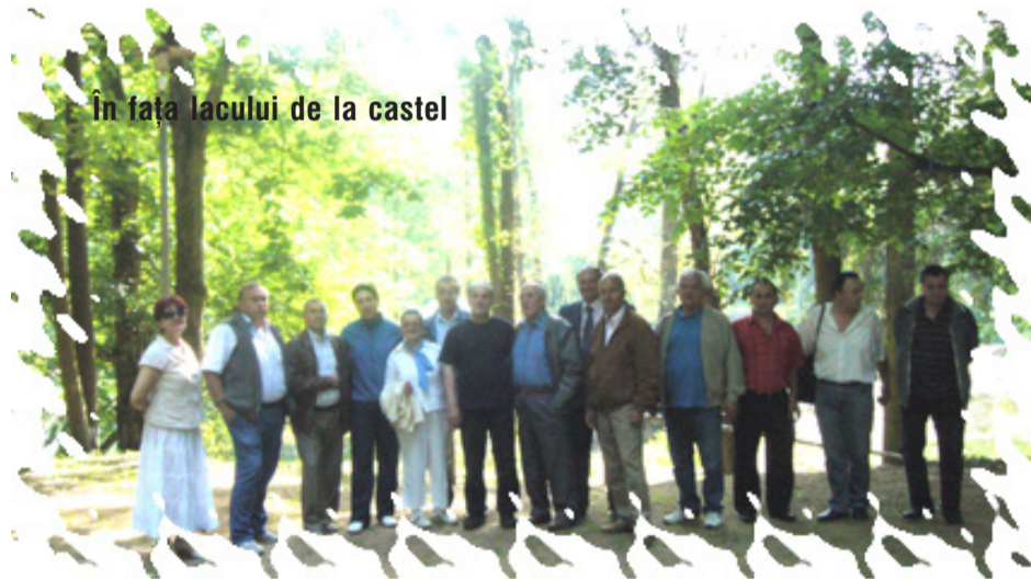
În fața lacului de la castel