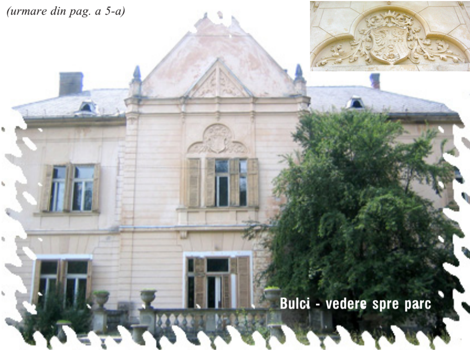
Bulci - vedere spre parc

Criteriul unu și patru semnifică curgerea neîncetată a vremii. Cortul și brațul cu halebarda îi reprezintă pe participanții la confruntările militare. Porumbelul, dorința de pace și liniște. (Pentru prezentarea unor însemne heraldice, a semnificației lor și a arborelui genealogic a Mocioneștilor, vezi: M. Dogaru, D. Stoi, A. Mureșan, I. Popovici, Heraldica în slujba cercetării istorice: Evoluția însemnelor heraldice aparținând familiei Mocioni, în Ziridava, XIX-XX, 1996, p. 395-402).