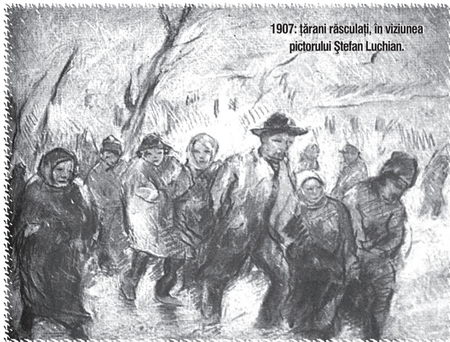
1907: țărani răsculați, în viziunea pictorului Ștefan Luchian.

Înșela marele însingurat de la Paris, Emil Cioran, atunci când în Jardin de Luxemburg, îl atenționa protector pe un evreu din America, pictor cu preocupări metafizice, spunându-i: „Aveți grijă, ce se va întâmpla când americanii își iau mâna de pe evrei!” Corect, cred eu, și va confirma istoria, îndemnul la prudență ar fi trebuit să sune astfel: „Aveți grijă ce se va întâmpla cu America când Israelul își va lua mâna de pe ea”. ● Când părăsești Bucureștiul cu avionul, având destinația Paris, trecerea rapidă are un asemenea impact încât senzația pe care o încerci în momentul în care ai ajuns, o compari cu secvența filmului „Vrăjitorul din Oz”, unde imaginea alb-negru devine tehnicolor. ● Ca unul care „a trăit în imaginație, ceea ce experiența istorică prea tânără