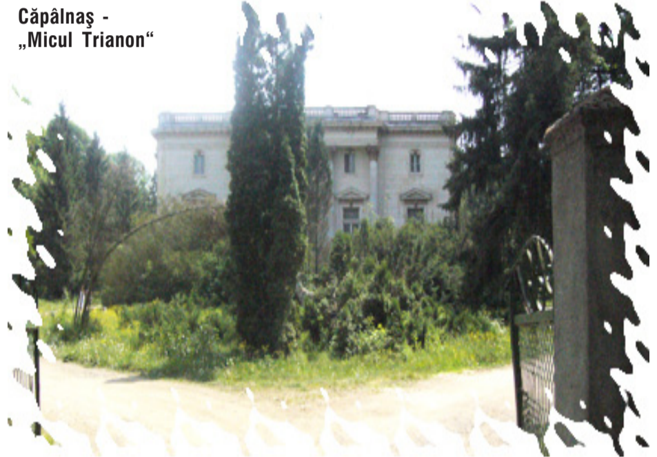
Căpâlnaș - „Micul Trianon“

de Birchiș, care avusese mare simțire pentru muzică. Mocioni avea pentru fiecare câte un loc de muncă, bine plătit, în așa fel ca țărănul să fie mulțumit. Un fecior în casă era plătit cu 150 lei, leul având atunci valoare, nu ca și astăzi. Pe deasupra, fiecare beneficia de trei sferturi de lanț de pământ, gata pregătit: arat, semănat, trebuia numai să-l prășești și să-ti duci recolta acasă, la care se mai asigura și transportul, cu utilajele de la castel. Slujbașii mai primeau 100 kg de grâu, 50 kg porumb, 50 kg orz, 1 metru cub de lemn, lunar.