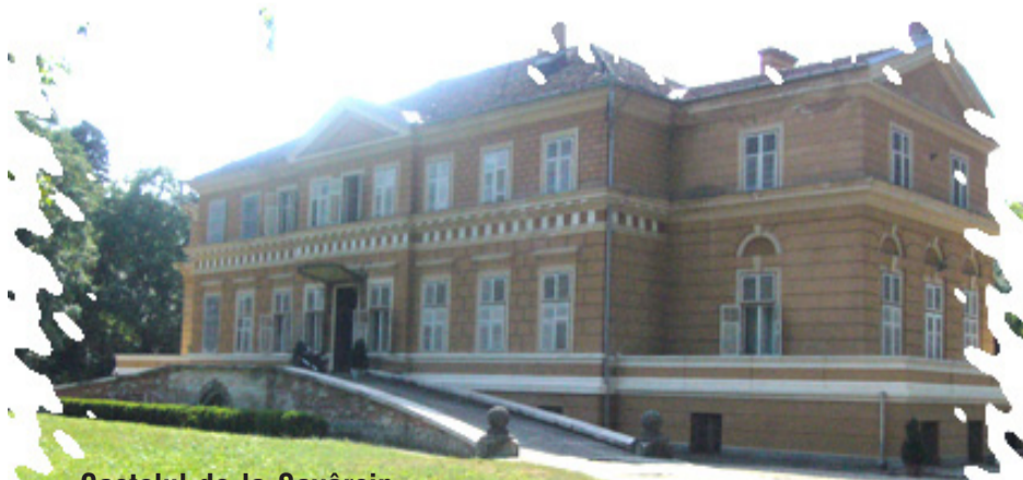
Castelul de la Săvârșin

Într-un număr din anul 1881 al ziarului de limbă maghiară: „Arad es vidcke” (Aradul și împrejurimile), Teglas Gabor dă următoarea descriere a castelului din Săvârșin: