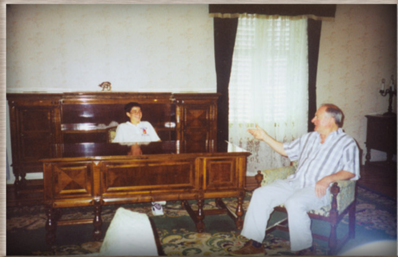
Biroul fostului președinte, Nicolae Ceaușescu, la Săvârșin