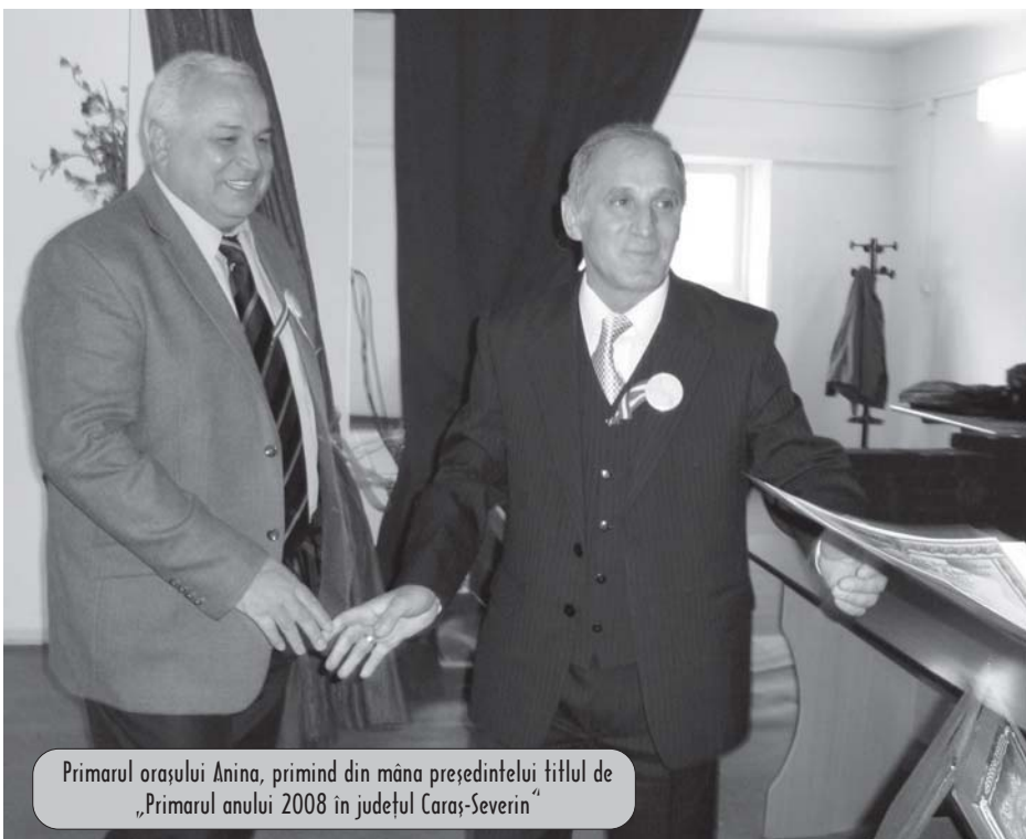
Primarul orașului Anina, primind din mâna președintelui fitlul de „Primarul anului 2008 în județul Caraș-Severin”

cetate nu poate dăinui în afară dacă se dezbină înăuntru”. Prieteni, dacă vrem să mai rămânem oameni, trebuie, cu slovă viforoasă, să oprim astfel de rătăni. Numai așa ne vom mai regăsi români în Banatul nostru drag unde, iată, într-o admirabilă simbioză creștină, trăim laolaltă în această sală, olteni cu moldoveni, dobrogeni cu bihoreni, machedoni cu maramureșeni și dacă ne uităm bine, avem chiar și bănățeni printre noi, ca să închei într-o notă veselă.