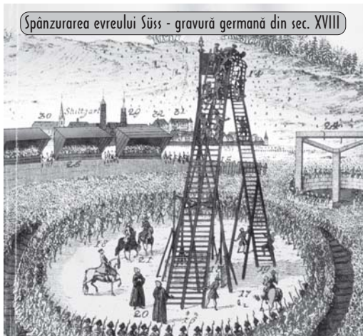
Spânzurarea evreului Süß - gravură germană din sec. XVIII

Istoricul îl descoperă pe „Evreul de Curte” la sfârșitul Evului Mediu. El își consumă biografia în epoca agitată a Războiului de 30 de ani și a