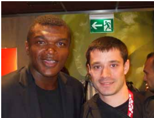
Alexandru Todî, conducătorul delegației noastre la Campionatul European de fotbal, alături de marele fotbalist Marcel Desailly, fost campion mondial în 1998 și european în 2000 cu Franța, azi ambasador onorific al UNICEF.