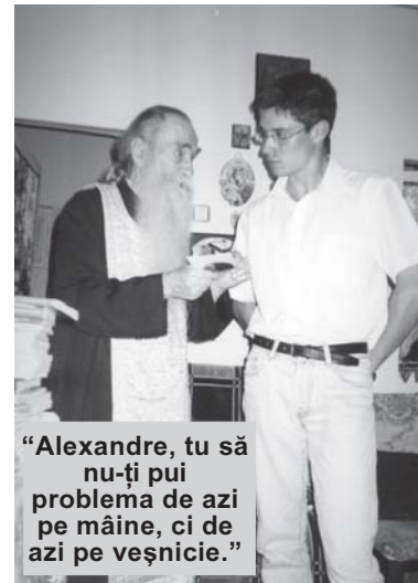
“Alexandre, tu să nu-ți pui problema de azi pe mâine, ci de azi pe veșnicie.”