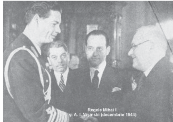
Regele Mihai I și A. I. Vizinski (decembrie 1944)