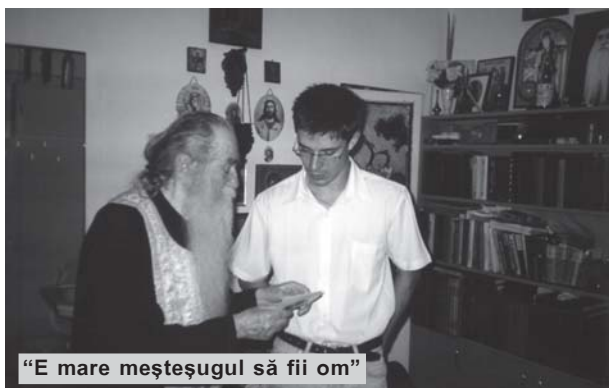
“E mare meșteșugul să fii om”

– Am fost invitat, acum un număr de ani, să vorbesc la București unor studenți. M-am dus cu plăcere și am vorbit patru zile. În acest timp am acordat un interviu televizat domnului Arachelian, pe care din începutul emisiunii l-am avertizat spunându-i așa: domnule Arachelian eu sunt aromân de origine. Și, imediat după emisiune m-am trezit cu doi preoți. Distinși, serioși preoți, macedoneni care, auzind mărturisirea făcută în emisiune, mi-au propus să mă facă patriarhul aromânilor cu sediul la sârbi. Eu le-am spus: „Domnilor nu-i cunoașteți pe greci?” Apoi venind valurile de necazuri peste sârbi s-a mai întârziat următorul