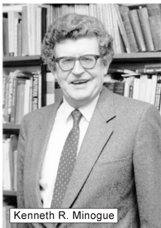
Kenneth R. Minogue

Pentru a ilustra versiunea contemporană a internaționalismului, conservatorul american Kenneth R. Minogue a propus sintagma olimpianism, care indică, în esență, o atitudine, un mod de a gândi, un mod de a simți, chiar o doctrină. Olimpianismul este un nou soi de „detașare”, iar principala solidaritate a olimpianului este „cu cei care împărtășesc credința lui, indiferent cine ar fi aceștia, în contradicție cu concetățenii săi”. Puterea și particularismul olimpianismului în secolele al XX-lea și XXI-lea datorează mult reflecției despre cele două războaie mondiale, al cărei pivot principal a fost ideea că „loialitățile naționale și ideologice au dus la moarte și distrugere”. Ce a urmat a fost concluzia precipitată că naționalismul a fost cauza fundamentală a uriașelor conflagrații mondiale; de aici ideea că însuși conceptul de suveranitate națională e un „anacronism periculos”. Calea virtuții trebuie, de aceea, să constea în redirectionarea loialităților umane de la agresivitatea colectivă către cooperarea internațională. O utopie a perfecțiunii organizate poate fi întrezărită de olimpianul educat ca un orizont îndepărtat către care trebuie să ne îndreptăm - adevăratul obiect al loialității pentru cei capabili să transcendă „atracția loialității naționale”.