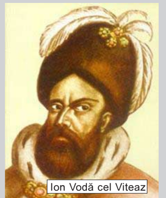
Ion Vodă cel Viteaz

În aceste condiții, cu excepția lui Ion Vodă cel Viteaz, ar fi hazardat să căutăm dovezi de loialitate și devotament sau dăruire pînă la sacrificiu față de interesele țării. Domnitorii - exceptând cazul invocat - nu au autoritatea necesară luării unor decizii de maximă importanță pentru destinele românilor, fapt ce explică deteriorarea lentă dar sigură, dureroasă a climatului social.