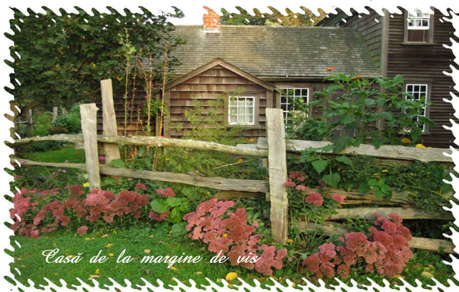
Casă de la margine de vis

Îmi făcea injecțiile bine, Dar ăsta nou de-a venit,