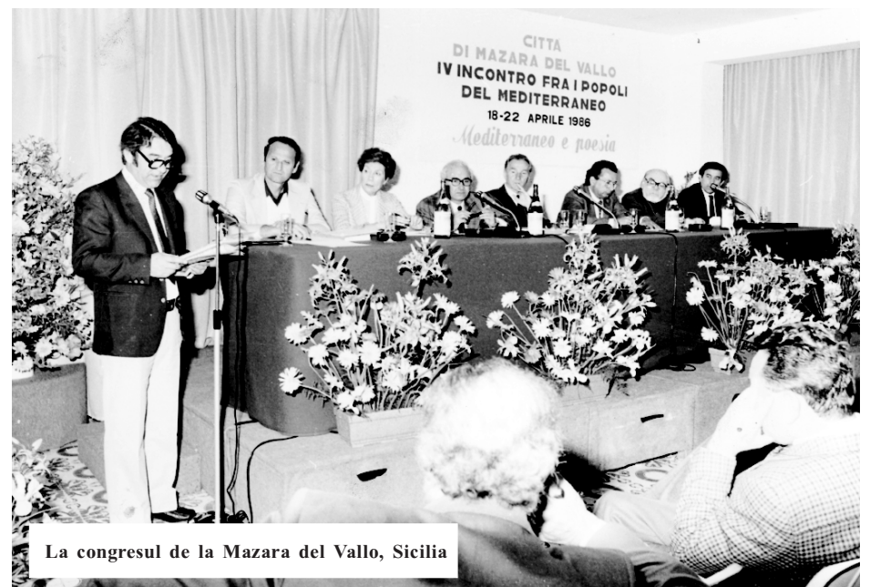
La congresul de la Mazara del Vallo, Sicilia

- De ce să nu cred? Sau măcar sper că se va produce o renaștere românească. Mă rog pentru ea.