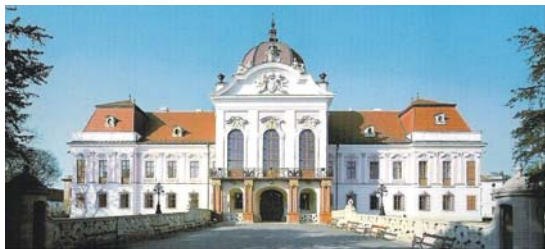
Fațada palatului de la Gödöllő

La Budapesta, locul de vilegiatură al familiei imperiale era castelul Gödöllő. Un palat baroc, înconjurat de un parc, astăzi mai degrabă o pădure redevenită sălbatică. Aflat la numai 28 Km de Budapesta, accesibil mulțumită unui tren suburban care reînvie ambianța desuetă a anilor '30, Gödöllő este unul din punctele de atracție majore din vecinătatea capitalei maghiare, însă numai de câțiva ani, de când a devenit muzeu și este în curs de a-și obloji rănile, recuperând pas cu pas splendoarea de altă dată.