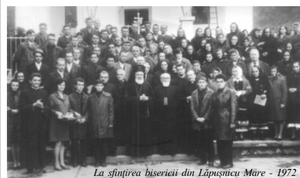
La sfințirea bisericii din Lăpușnic Mare - 1972

După ce a plecat în India s-a întors, o vreme a stat la Roma, din câte știu, pe urmă la Paris și sigur când a murit – ultimele zile