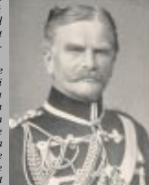
Generalul von Mackensen