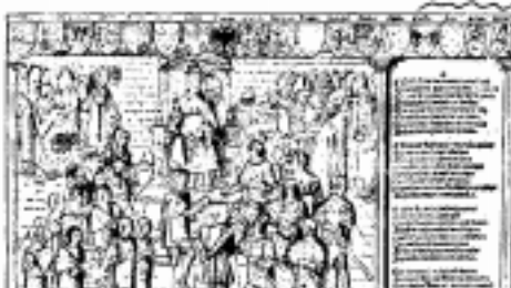
Semnalul cruciadelor este dat în anul 1095 la Conciliul de la Clermont de către Papa Urban II

Către sfârșitul primului mileniu, papalitatea începe susținută și prelungită ei ofensivă pentru