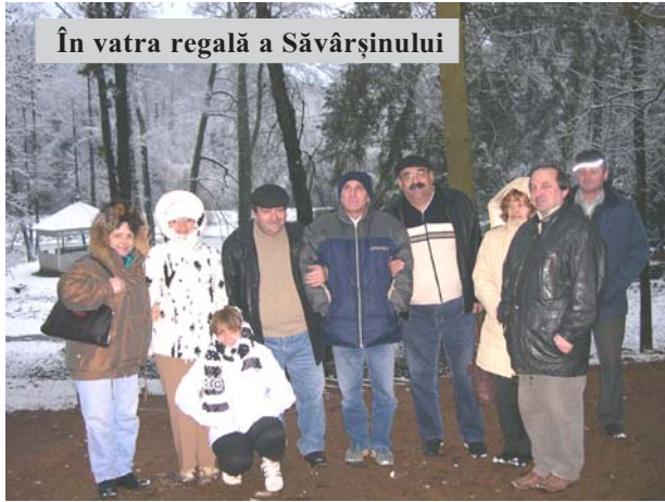
În vatra regală a Săvârșinului