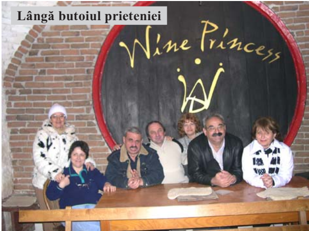
Lângă butoiul prieteniei

toamna preda elegant ștafeta lângă un copac albit de bucurie – iernii.