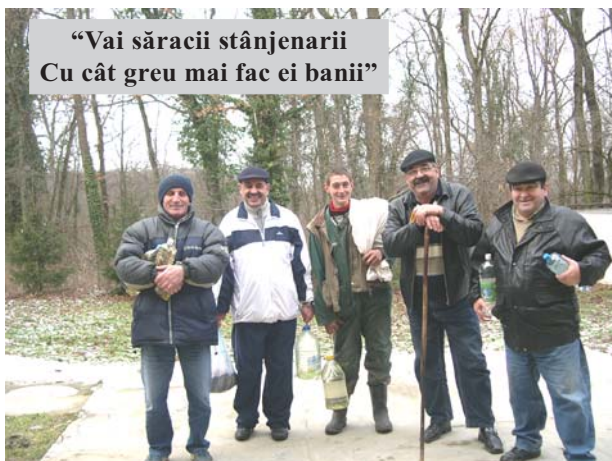
“Vai săracii stânjenarii Cu cât greu mai fac ei banii”

Apoi îl silește să ne privească într-o oglindă. – „Acum ce vezi?” – „Pe mine”. – De ce? Întreabă din nou comentatorul, și la fereastră e sticlă, și aici e sticlă. De ce în oglindă te vezi doar pe tine? Să-ți spun eu: fiindcă oglinda are argint, și ori de câte ori apare argintul, nu te mai vezi decât pe tine”.