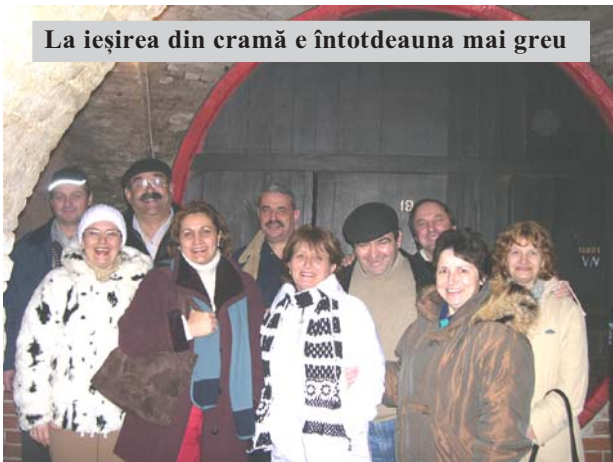
La ieșirea din crămă e întotdeauna mai greu

fel de Sandra Brown, din vremea sa. Ca să vedeți că doar fericita prostie e repetabilă în țara asta, altfel, în acești ultimi 16 ani s-ar fi găsit bani pentru reeditarea acestei capodopere țărănești laureată la Stockholm.