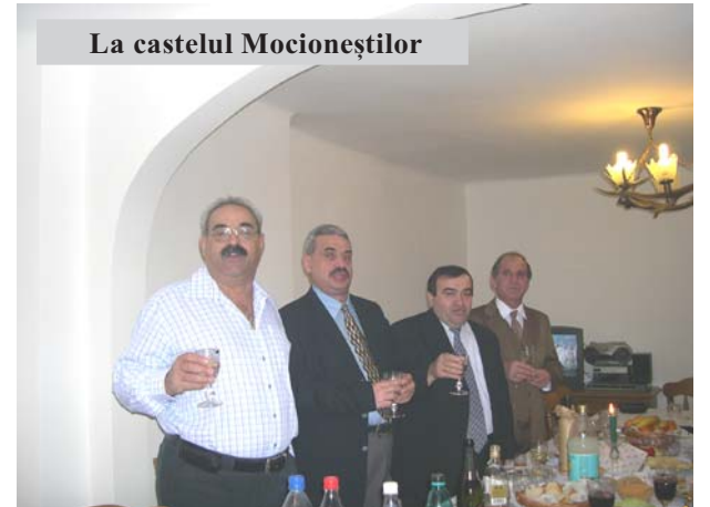
La castelul Mocioneștilor

Ni s-a spus: „e dulce raiul cel cu zâne și belșuguri” Eu vă spun că este dulce zeama boabelor de struguri,