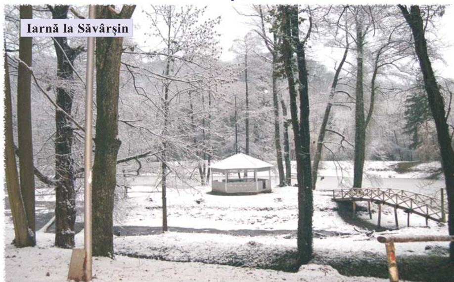
Iarnă la Săvârșin

ordinea zilei. Ipocrizia i-a găsit țapi ispășitori însă numai pe români, ca și