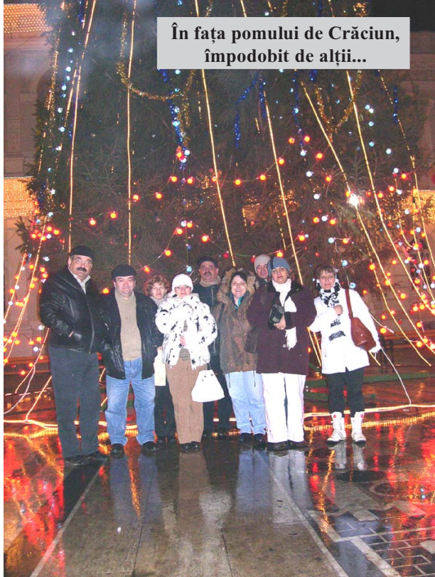
În fața pomului de Crăciun, împodobit de alții...