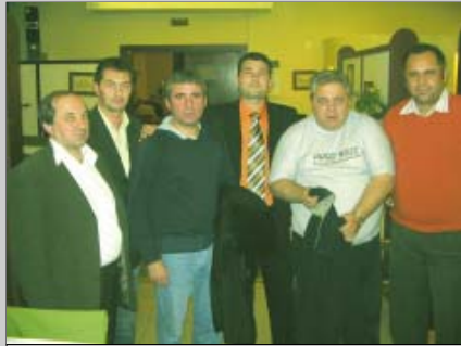
Înconjurat cu dragoste frățească de membrii comunității armânilor din Banat, Gheorghe Hagi poate fi garanția sigură că filiala bănățeană a comunității va fi mereu „fruncea”.