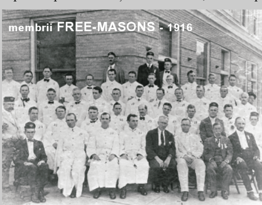
membrii FREE-MASONS - 1916

Prestigiul operative, precum și sale autonomii față de statele au atras constructorilor tot aristocrații și cultura. Aceștia nu meșteșugari zidari, loc unde să se poată spiritual în libertate, fraternitate, fără cenzură a statului