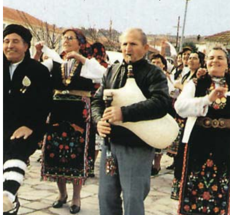
Aromâni din Grecia, în a doua zi de Paști

îndepărtate –/ca niște grele și imense răni de catifea./ Dar așa, rănit, pe vârful m-asteaptă./ la balul luminii,/și steaua mea...”