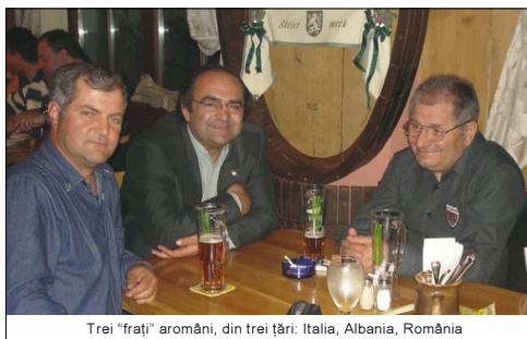
Trei "frați" aromâni, din trei țări: Italia, Albania, România

P.S. Unii cititori m-au întrebat prin intermediul internetului de ce nu dau mai multe detalii despre această deplasare prin „cenușa imperiului”. Mă bucur că revista pe care o conduc de la facerea ei, are un număr atât de mare de cititori electronici, dar eu scriu convins - și ei trebuie să mă creadă - că mai importantă decât coaja este substanța.