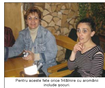
Pentru aceste fete orice întâlnire cu armăni include șocuri.

Nicolae Dumba, marele industriaș vienez, s-a născut în 24 iulie 1830, la Viena, și a decedat în 23 martie 1900, la Budapesta. Nu există enciclopedie serioasă a Austriei ori Ungariei care să nu-i pomenească numele. A terminat strălucit studiile, după care a preluat conducerea unui mare stabiliment de țesătorii în Wiener-Neustadt. La 35 de ani, devine vicepreședinte al Băncii Imperiale. Tot atunci se căsătorește