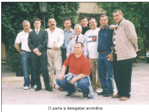
O parte a delegației aromâne

Pentru istoria neamului Dumba – și acest neam chiar a făcut istorie –