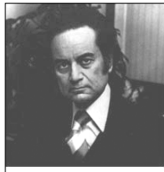
Agha Hasan Abedi

Pe piața financiar-bancară, în anul 1972 își face apariția Banca de Credit și Comerț Internațional creată a financiarului pakistanez Agha Hasan Abedi având ca principali investitori Bank of America, emiratul Abu-