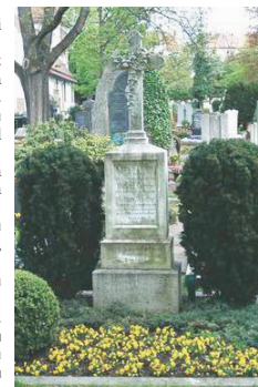
DAIMLER - MORMÂNTUL MODEST

A murit la 29 decembrie 1919, în Kannstatt, în același an cu Karl Benz. Astfel, ultimii pionieri europeni ai automobilisticii au dispărut de pe scena lumii.