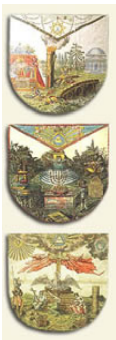
Sorturi ale Ordinului II, III și IV ale Ritului Francez. Modele propuse de Casa Guerin în timpul Primului Imperiu