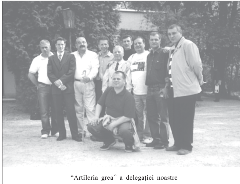
“Artileria grea” a delegației noastre