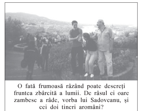
O fată frumoasă răsând poate descreți fruntea zbârcită a lumii. De răsul ei oare zambesc a râde, vorba lui Sadoveanu, și cei doi tineri aromâni?