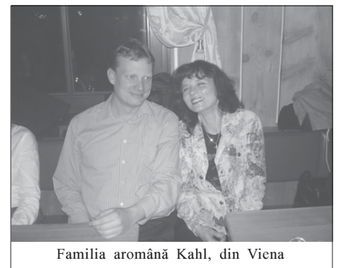
Familia aromână Kahl, din Viena

„Teiule, tu nu dai fructe; Recunoști, rodirea doare, Numai tu din toți copacii Știi să te oprești la floare.”