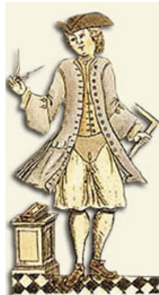
Prima reprezentare a unui mason francez, cu șort, echer și compas

În România în prezent funcționează două rituri: Ritul Scoțian Antic și Acceptat și Ritul York, care aparțin Masoneriei regulate. Unele entități masonice, precum Marele Orient al Franței, s-au declarat agnostice, adică în imposibilitate de a cunoaște ceva despre existența lui Dumnezeu. Ca atare, ele au eliminat orice referire la Marele Arhitect al Universului, au scos Cartea Sacră dintre luminile lojii și au modificat gradele creștine, renunțând la amintirea lui Iisus Hristos. Se poate deci susține că ele, sunt practic atee și în mod cert anticreștine.