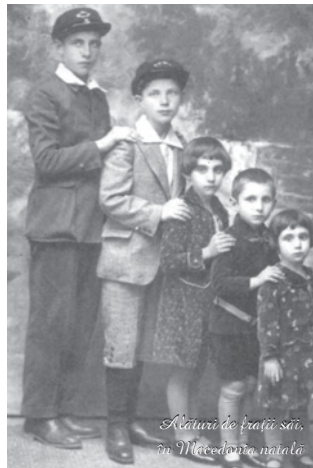
Această familie, în Mădăria natală