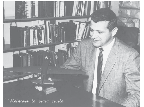
Reîntors la viața civilă