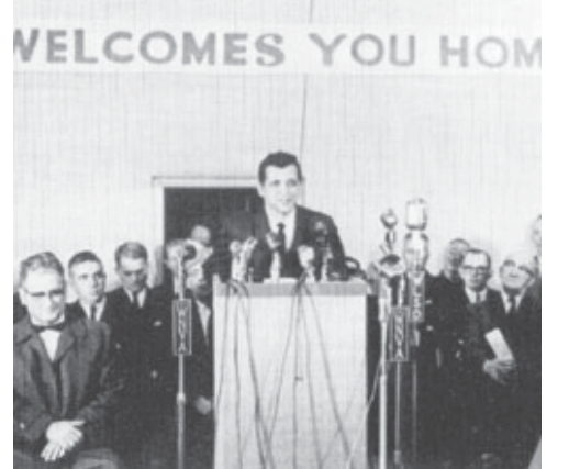
Din nou în SUA