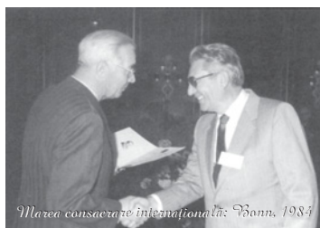
Marea consacrare internațională: Bonn, 1984