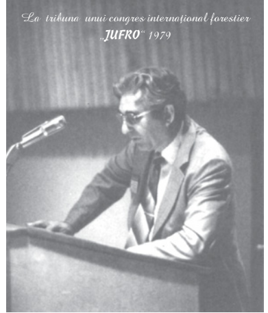
La tribuna unui congres internațional forestier "JUFRO" 1979