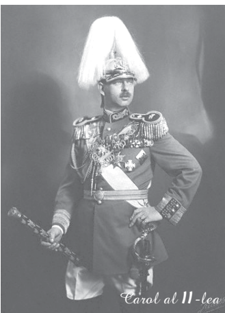
Carol al II-lea