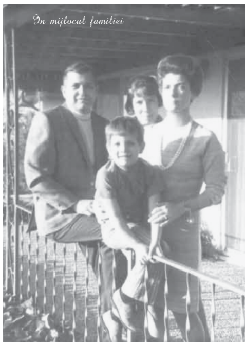
În mijlocul familiei

Directorul adjunct al CIA a cerut în mai multe rânduri aprobarea lui Eisenhower pentru efectuarea zborurilor, dar, din cauza vremii nefavorabile, aceste zboruri trebuiau tot timpul amânate. În plus, Eisenhower a ținut să-i precizeze că nu se va efectua nici un zbor după data de 1 mai!