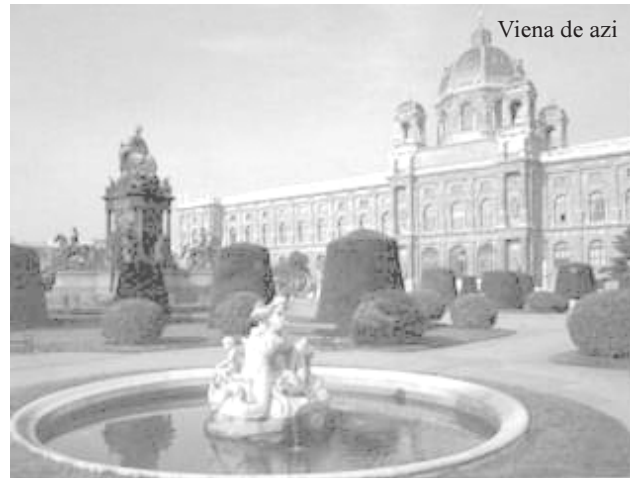
Viena de azi