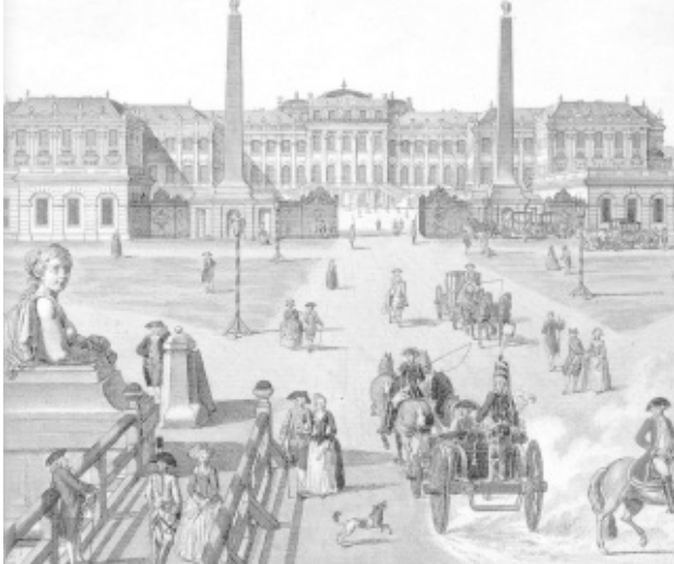
Viena de ieri