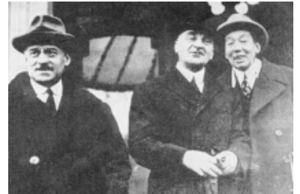
...Duca și Maniu