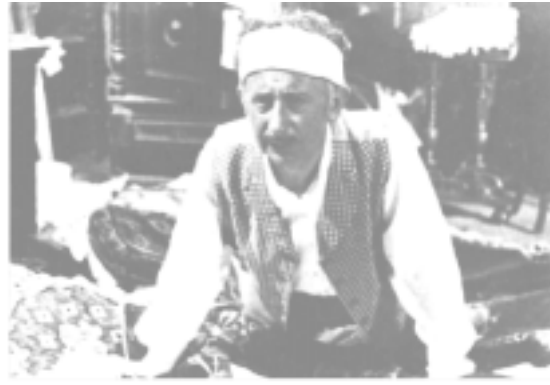
În filmul artistic „Două loturi” (1957)