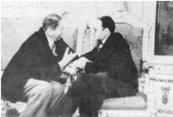
Nicolae Titulescu împreună cu Armand Călinescu...