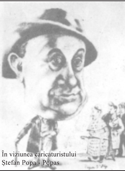
În viziunea caricaturistului Ștefan Popa - Popas

A ilustrat toate genurile. A jucat farsă, revistă, operetă, comedie și dramă. Toate cu aceeași credință, cu aceeași dăruire. Și a izbutit în toate la fel de strălucit. Fiindcă Birlic, acest omuleț ce părea căzută el însuși dintr-o Commedia dell'Arte , era numai teatru în toate visurile, aspirațiile și nădejile lui.