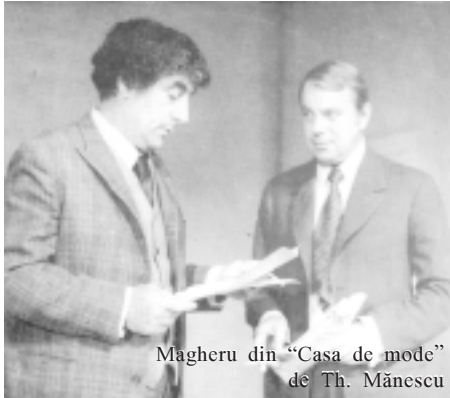
Magheru din „Casa de mode” de Th. Mănescu