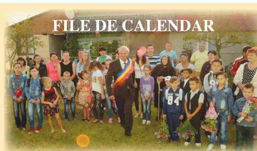
FILE DE CALENDAR

Fiecare dintre noi avem oameni dragi nouă care acum sunt în vârstă. Aceasta e legea vieții. Noi trebuie să ne gândim la cei patru milioane de pensionari care au muncit o viață întreagă ca, acum, la bătrânețe se descurce cu greu... Gândurile mele se îndreaptă spre toți pensionarii localităților Berzovia, Ghertenis și Fibiș. Poate că o duc mai greu din punct de vedere material, dar pentru ei să fie numai zile cu soare, să aibă sănătate, bucurii și fericire în suflet! Bunul Dumnezeu să vă dea viață îndelungată și liniște până la adânci bătrâneți. Cu stimă, vă sărut mâna care poate vă tremură și obrazul îmbătrânit de vreme!