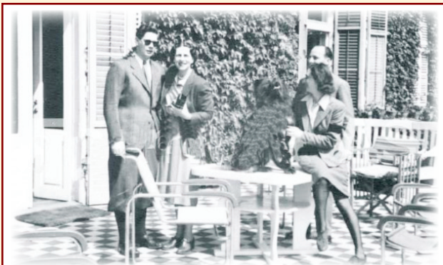
Regele Mihai și Regina-mamă Elena, pe terasa castelului de la Bulci, în iulie 1944