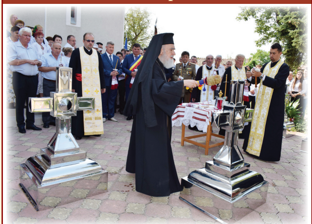
Înaltpreasfințitul Timotei al Aradului sfințind crucea bisericii din Vinga