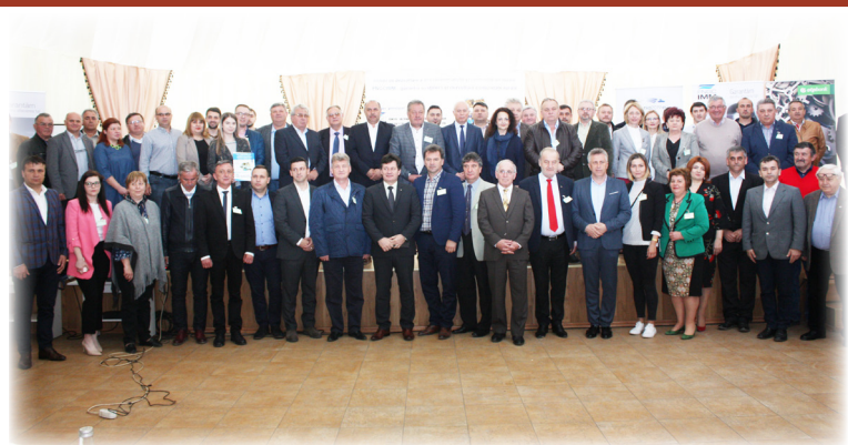
Întrunirea membrilor „Asociației Primarilor din Banatul Istoric”, cu conducerea Fondului Național de Garantare a Creditelor pentru Întreprinderile Mici și Mijlocii. (Săvârșin, 2 aprilie 2019)