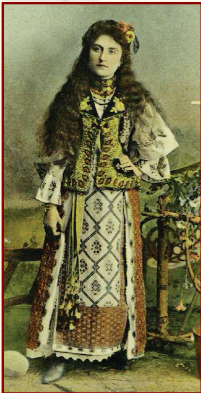
Costumul popular este taina sufletului femeii.