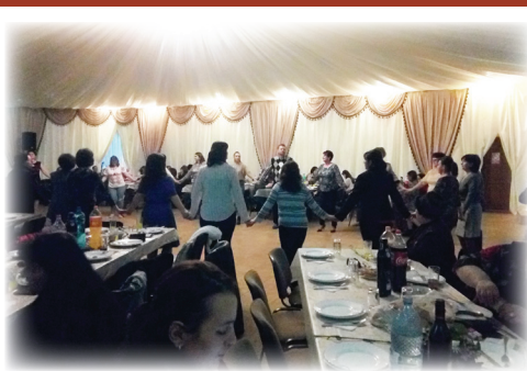
Imagine de la evenimentul dedicat femeilor - 8 Martie 2019