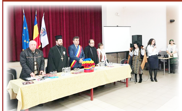
Imagine de la simpozionul „Pe-al nostru steag e scris unire”, desfășurat în Căminul Cultural al localității Vinga