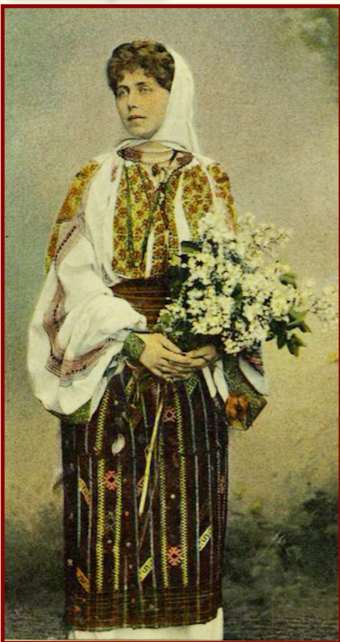
Principesa Maria, în frumusețea straiului popular românesc.