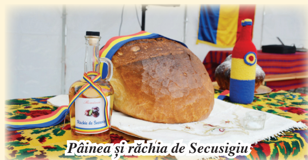
Pâinea și răchiua de Secusigiu