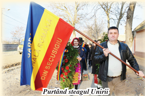
Purtând steagul Unirii