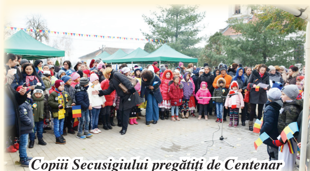
Copiii Secusigiului pregătiți de Centenar