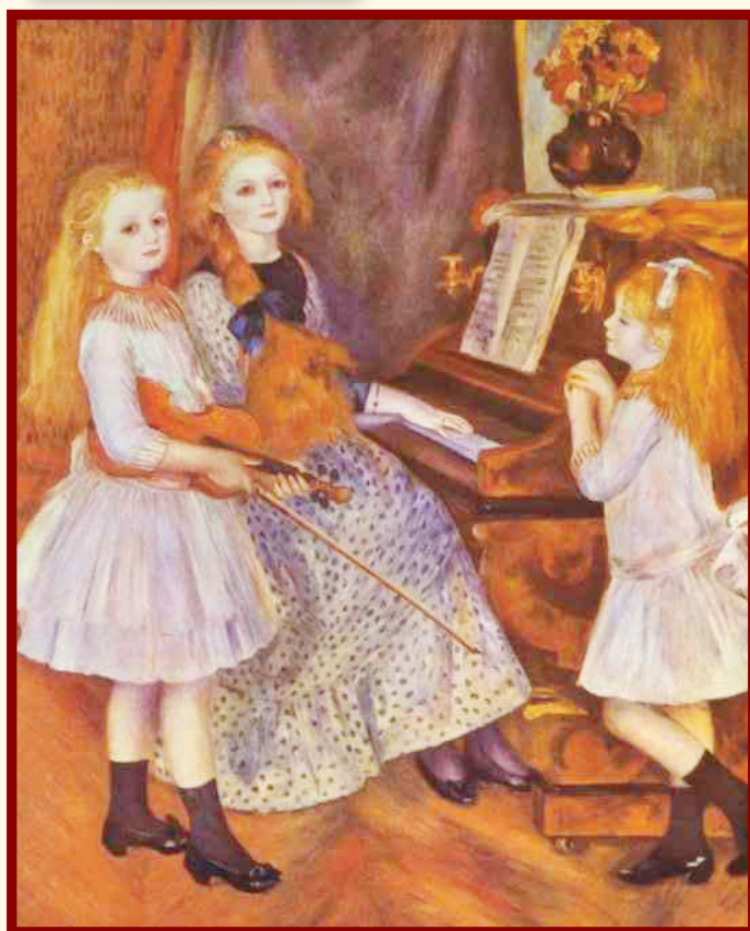
Pierre Auguste Renoir - Fiițele lui Catulle Mendes - 1888

Artistul se remarcă în special datorită armoniei liniilor, strălucirii culorilor și șarmului intim cu care prezintă o largă varietate de subiecte. Renoir era interesat să picteze atât figuri umane, cât și peisaje sau naturi statice. La Renoir, compoziția și plasticitatea formelor nu se subordonează încercării de a reda efectele luminii. Dincolo de subiect, preocuparea principală este exprimarea generoasă ori senzuală a dragostei de viață, a tinereții și a petrecerii. Renoir nu s-a mulțumit să ne lase moștenire doar opera sa, ci a pus bazele unei adevărate dinastii artistice: actorul Pierre Renoir (1885-1952), producătorul de film Jean Renoir (1894-1979), artistul plastic Claude Renoir (1901-1969) și producătorul de film Claude Renoir (1913-1993) sunt doar câteva din personalitățile acestei frumoase familii.