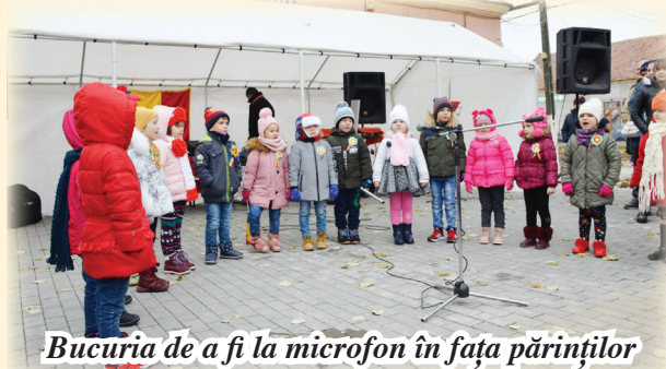
Bucuria de a fi la microfon în fața părinților