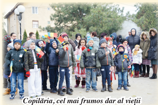
Copilăria, cel mai frumos dar al vieții