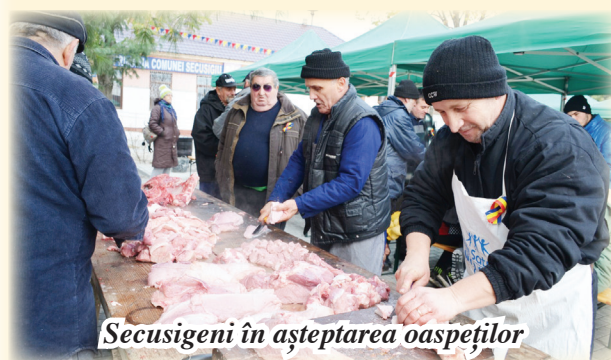
Secusigeni în așteptarea oaspeților