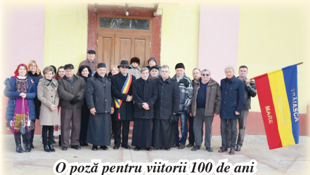
O poză pentru viitorii 100 de ani