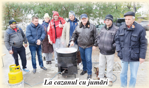
La cazanul cu jumări