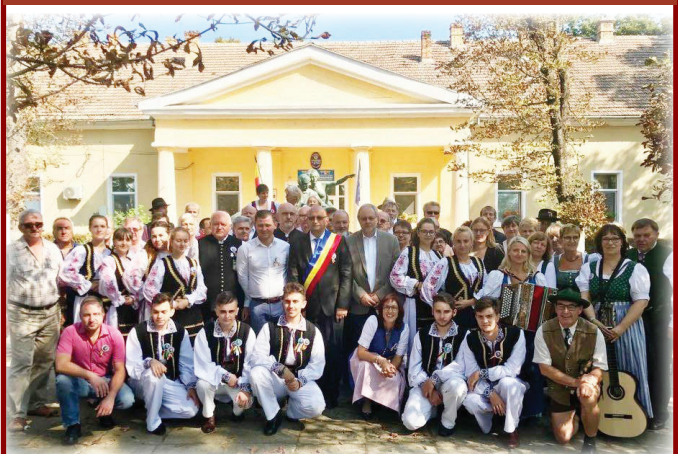
Lenauheim, un curcubeu multietnic