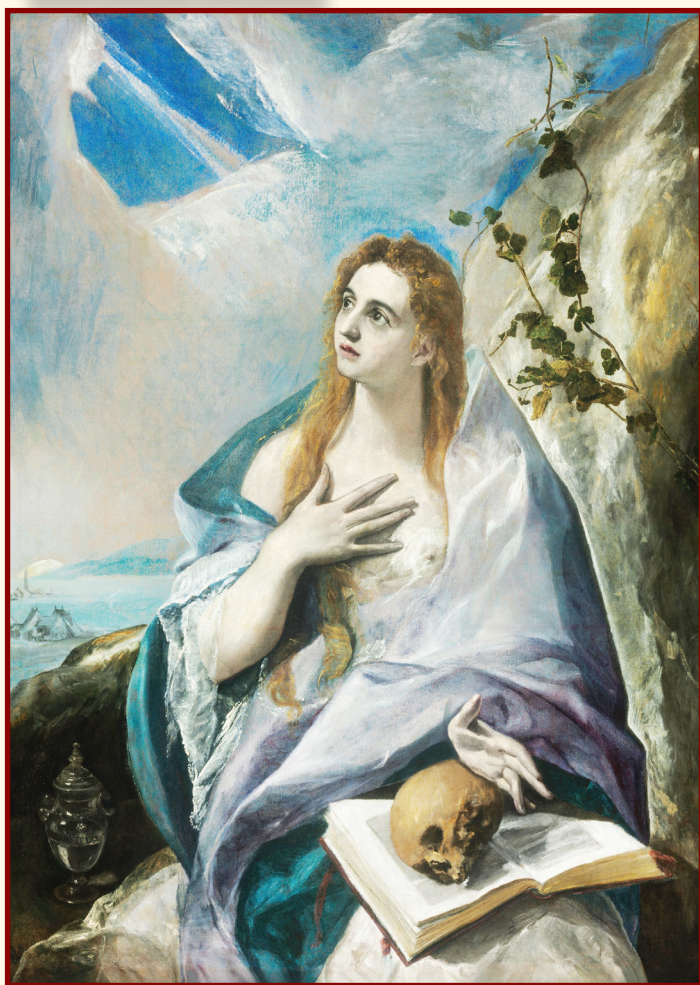
El Greco - Maria Magdalena în penitență (1576-1578)

M agdalena în penitență a fost pictată la începutul Manilor petrecuți de artist în Toledo. Poate fi observată influența picturilor cu aceeași temă de Tițian.