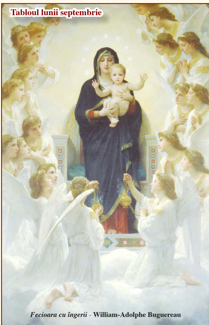
Fecioara cu îngerii - William-Adolphe Bouguereau

Picturile artistului sunt realizate în genul realismului artistic. Se remarcă prin contururile precise ale reliefului uman și folosirea unor nuanțe alese pentru culoarea pielii personajelor, precum și prin temele de inspirație mitologică.