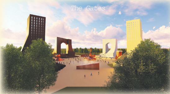
Lucrarea de artă monumentală „Porțile” propusă pentru a deveni simbolul Capitalei Culturale Europene 2021.

Cu multă plăcere pentru oamenii comunei mele.