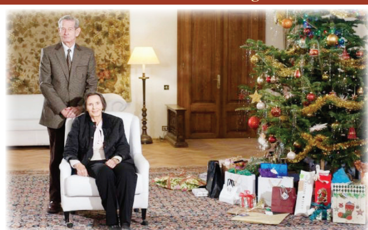
Regele Mihai I al României și soția sa, Ana de Bourbon-Parma, regina care i-a stat alături o viață, în zilele de Crăciun la Săvârșin.