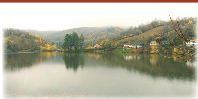
Poezia unui sfârșit de toamnă la Dognecea