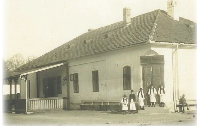
Restaurantul David - Bârzava

Privind imaginea de mai sus, îmi amintesc ceea ce îmi spunea, nu demult, domnul Gabriel Faur, primarul comunei Bârzava: „Iubirea pe care o porți locului în care te-ai născut nu este ceva ce se transmite ereditar sau un dar pe care ți-l dă societatea automat, dragostea pentru satul tău este o calitate pe care ți-o educi și o susții prin propriile fapte”.