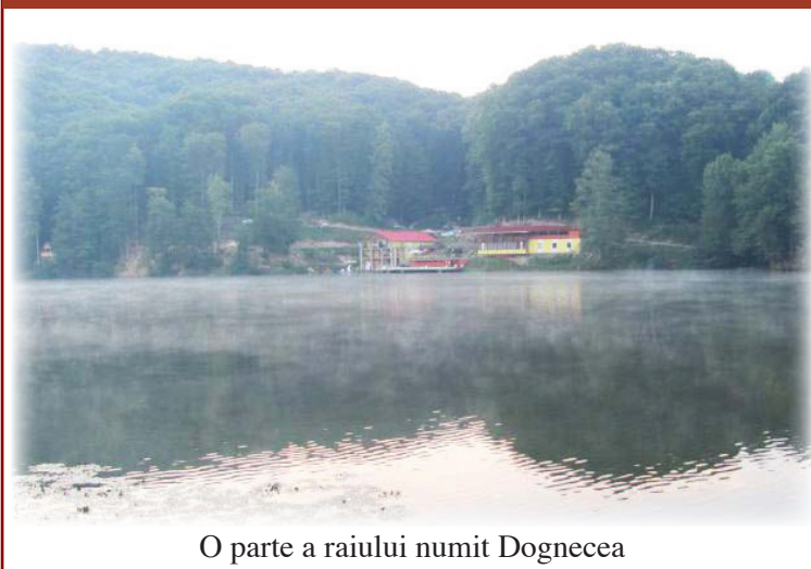
O parte a raiului numit Dognecea