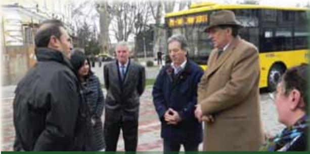
Domnul primar Marcel Vela, la recepția noilor autobuze

Noile autobuze cu care se vor plimba Caransebeșenii, de anul acesta, au fost recepționate de administrația locală. Suma care a fost plătită de la bugetul local al Primăriei municipiului Caransebeș, pentru patru autobuze nou-nouțe și două microbuze, este de peste patru milioane lei. Autobuzele sunt fabricate în România, au norma de poluare Euro 6 și podajul adaptat pentru accesul persoanelor cu handicap. Capacitatea fiecărui mijloc de transport în