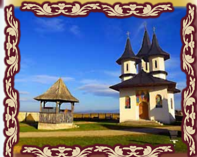
Mănăstirea Sf. Arhangheli Mihail și Gavril din satul Pietroasa Mare