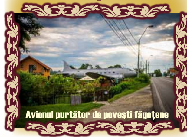
Avionul purtător de povești făgetene