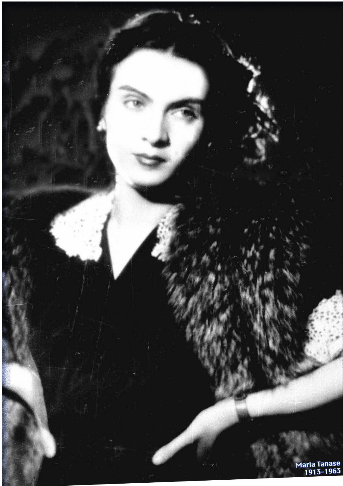
Maria Tanase 1913-1963