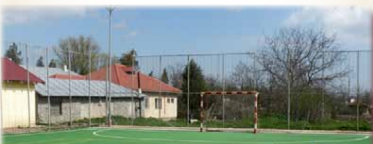
Terenul de fotbal din curtea școlii

Învățământul profesional și tehnic trebuie să contribuie prin oferta educațională și calitatea formării profesionale a absolvenților la dezvoltarea durabilă a comunității care sprijină această ofertă educațională, asigurând de asemenea, coeziunea economică și socială.