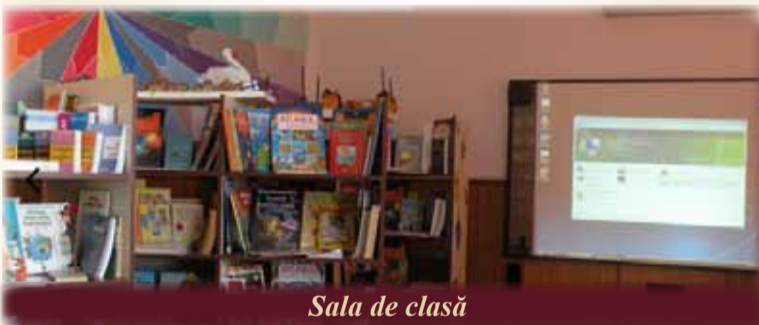
Sala de clasă

D upă vizita la primăria din Mihai Viteazu, următoarea a fost la liceul din localitate.