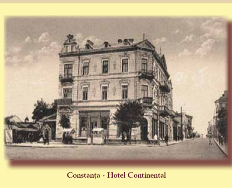
Constanța - Hotel Continental

După victoria asupra turcilor, prin tratatele de pace de la San Stefano și Berlin, Rusia țaristă și-a încălcat obligația de a respecta integritatea teritorială a României și a ocupat cele trei județe