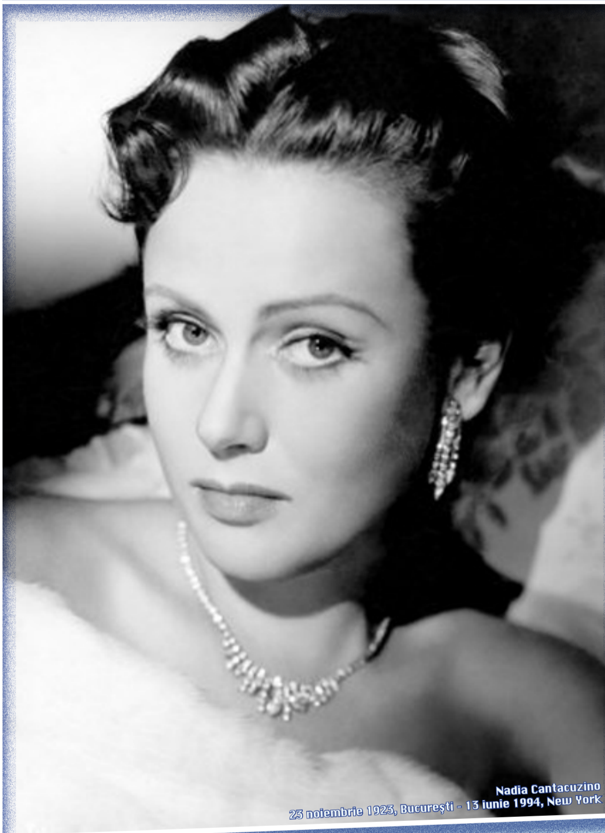
Nadia Cantacuzino 23 noiembrie 1923, Bucureşti - 13 iunie 1994, New York