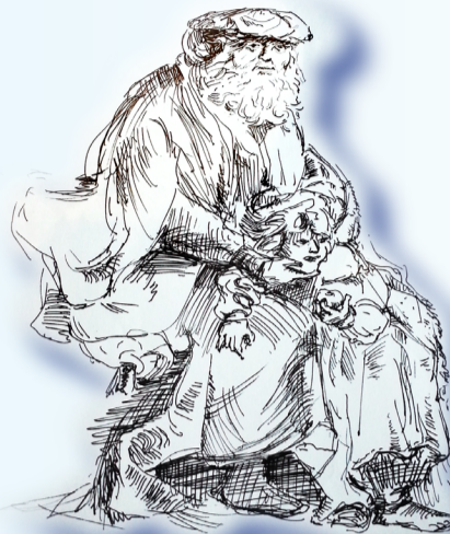
Marius FECHETE - Schiță în tuș - 2013

Despre „a avea”, n-am trăit suficient încă pentru a înălța acest de pe urmă verb la rangul meditației mele libere.