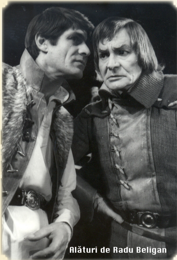
Alături de Radu Beligan

Nu știu, așa a fost să fie. În clasele primare mergeam cu mama la biserică și preotul mă tot ruga să spun la slujba de duminică, cu glas tare, rugăciunile Tatăl nostru și Crezul, în fața altarului, bucurându-mă întotdeauna de admirația enoriașilor. Cred, că de-acolo mi s-a