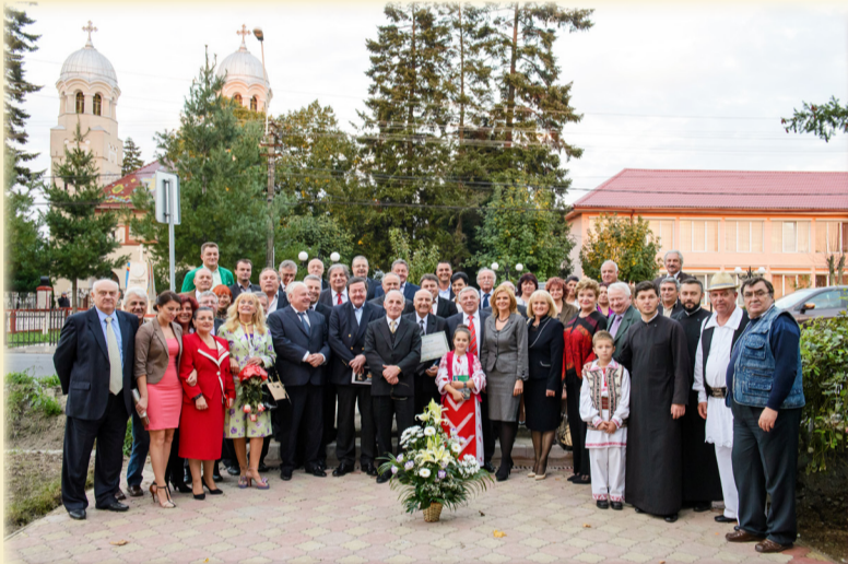
Membri ai Senatului Uniunii Jurnaliștilor din Banatul Istoric, alături de laureat și invitați. Ghiroda - 5 octombrie 2014

Le spunem, că cele două publicații reprezintă un univers aparte în peisajul publicistic din România de astăzi. „Banatul” este o revistă de administrație și de prezentare a unor repere istorice din comunitățile despre care revista vorbește. Este o revistă, care cu