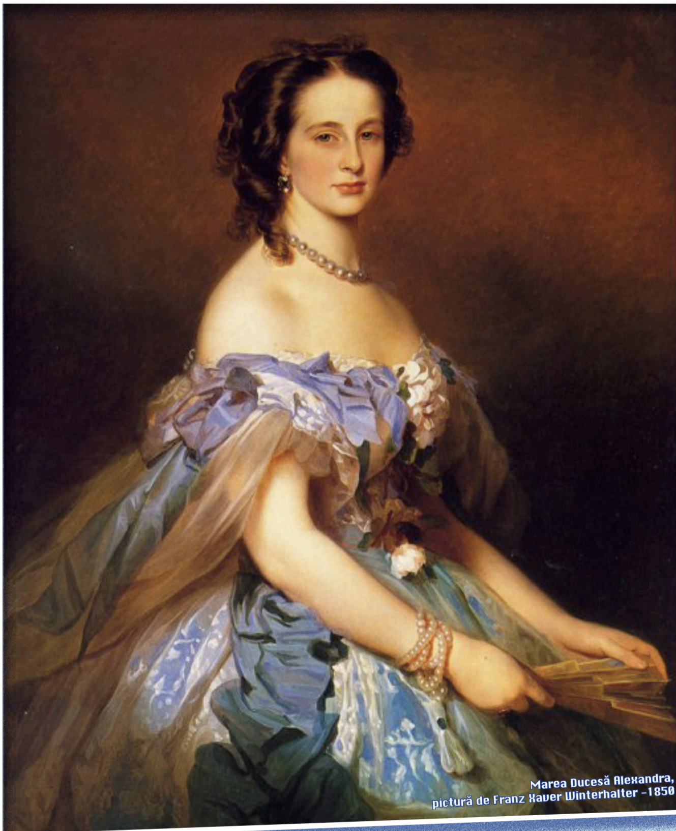
Marea Ducesă Alexandra, pictură de Franz Xaver Winterhalter - 1850