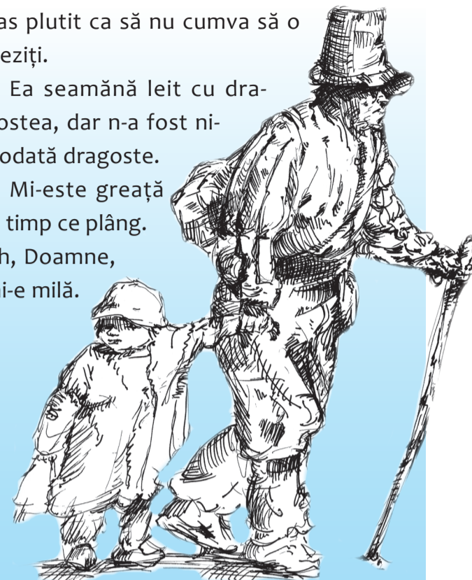
Marius FECHETE - Schiță în tuș - 2003