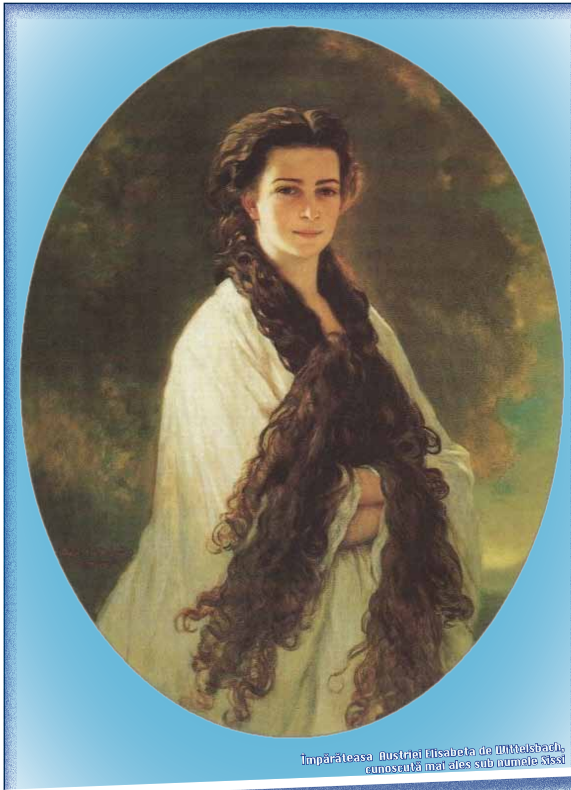
Împărăteasa Austriei Elisabeta de Wittelsbach, cunoscută mai ales sub numele Sissi